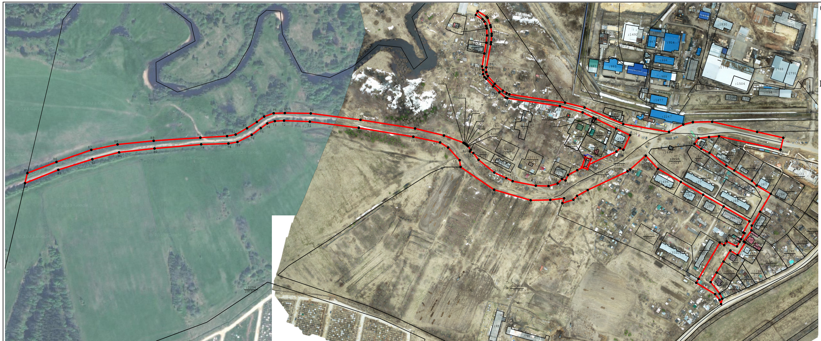
Масштаб 1:4 000